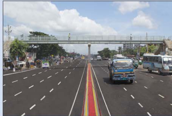
৮-লেনে উন্নীত যাত্রাবাড়ী-কাঁচপুর মহাসড়কে নির্মিত ফুট ওভারব্রিজ