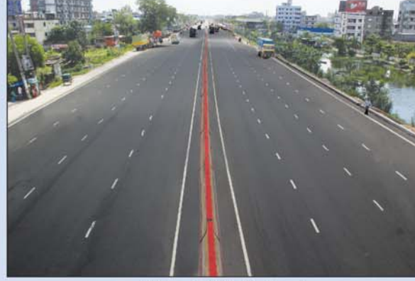
৮-লেনে উন্নীত যাত্রাবাড়ী-কাঁচপুর মহাসড়ক

এ প্রকল্পটি বাস্তবায়নের ফলে যাত্রাবাড়ী-কাঁচপুর জাতীয় মহাসড়ক অংশের যানজট ব্যাপক হ্রাস পেয়েছে।