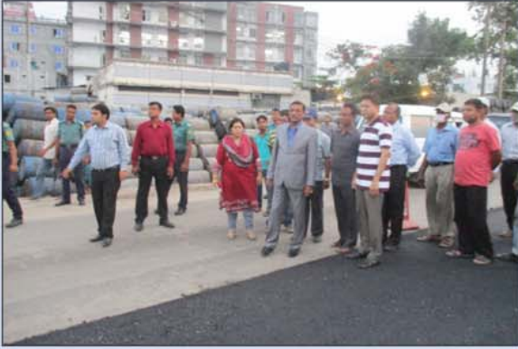
মাননীয় সড়ক পরিবহন ও সেতু মন্ত্রী কর্তৃক ৮-লেনের নির্মাণ কাজ পরিদর্শন