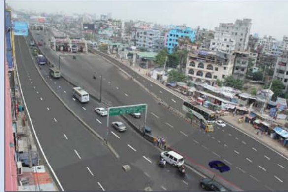
মেয়র মোহাম্মদ হানিফ ফ্লাইওভার এবং যাত্রাবাড়ী-কাঁচপুর মহাসড়কের সংযোগ স্থল