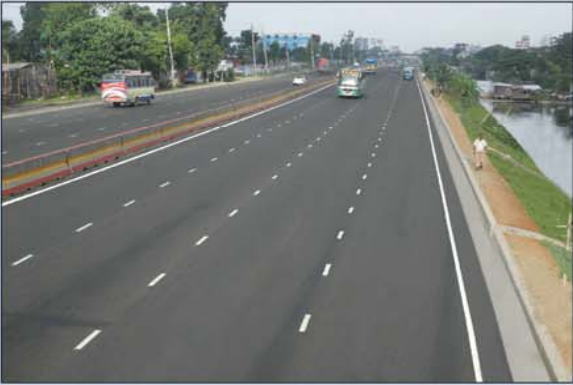
৮-লেনে উন্নীত যাত্রাবাড়ী-কাঁচপুর মহাসড়কে নির্মিত সসার ড্রেন