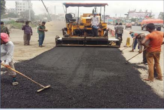
যাত্রাবাড়ী-কাঁচপুর মহাসড়কের চলমান বাইন্টার কোর্সের নির্মাণ কাজ