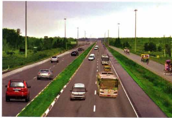
প্রক্ষেপিত জয়দেবপুর-চন্দ্রা-টাঙ্গাইল-এলেঙ্গা ৪ লেন মহাসড়ক