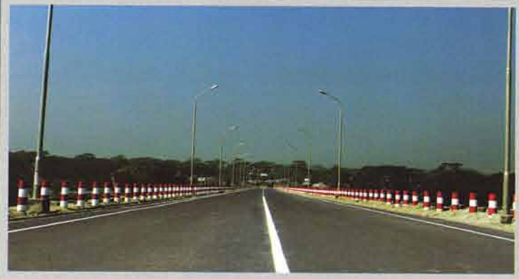
শেখ লুৎফর রহমান সেতুর এ্যাপ্রোচ সড়ক