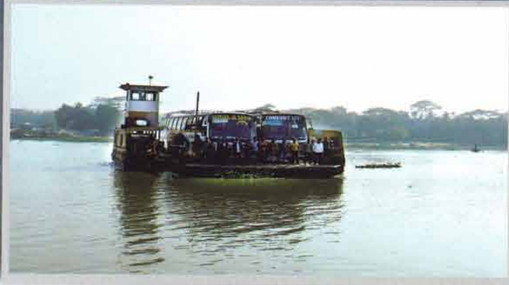
মধুমতি নদীতে পাটগাতি ফেরীঘাটে চলাচলরত ফেরী

মাননীয় প্রধানমন্ত্রী কর্তৃক নবনির্মিত শেখ লুৎফর রহমান সেতুর উদ্বোধনের মধ্য দিয়ে পিরোজপুর জেলার সাথে ঢাকার দূরত্ব প্রায় ২৫ কিলোমিটার হ্রাস পাবে। এর ফলে পিরোজপুর, বরগুনা, বাগেরহাট জেলার জনগণের যাতায়াত এবং পণ্য পরিবহন ব্যয় হ্রাস পাবে। উৎপাদিত কৃষি ও অকৃষি পণ্য বাজারজাতকরণ সহজতর হবে। সেতুটি এ অঞ্চলের মানুষের মনে নতুন আশার সঞ্চার করেছে এবং এতদঞ্চলের জনজীবনে ইতিবাচক পরিবর্তনের নতুন দিগন্ত উন্মোচন করেছে।