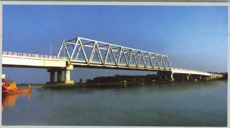
শেখ লুৎফর রহমান সেতু