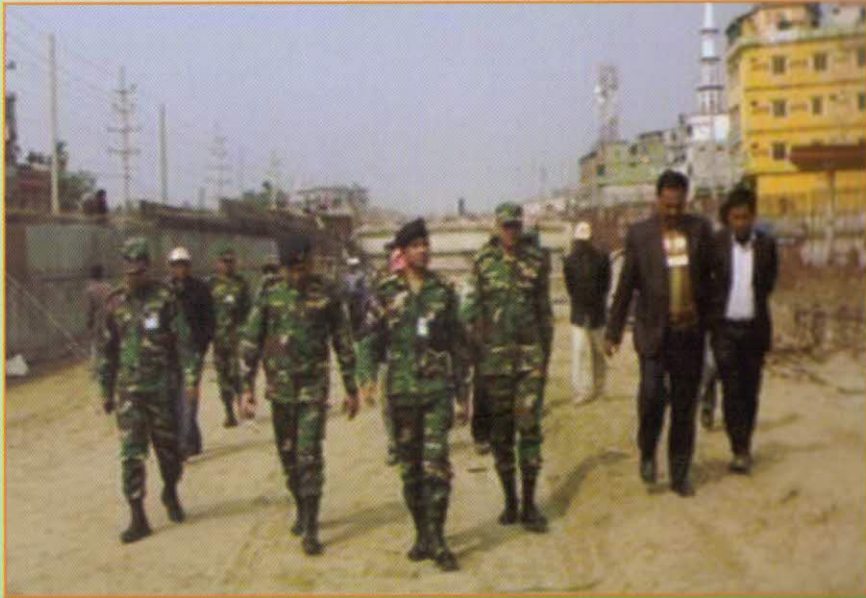
নির্মাণ কাজ পরিদর্শন করছেন মহাপরিচালক, এসডব্লিউও-পশ্চিম