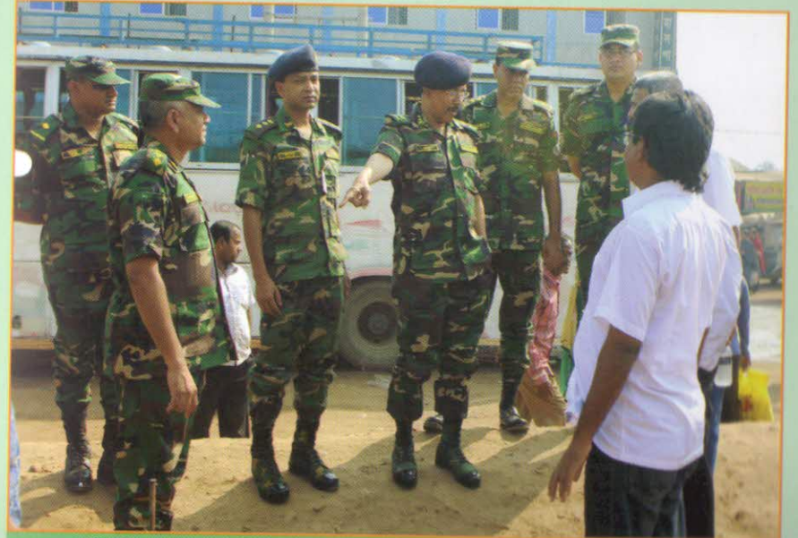
নির্মাণ কাজ পরিদর্শন করছেন মাননীয় ইঞ্জিনিয়ার ইন চীফ