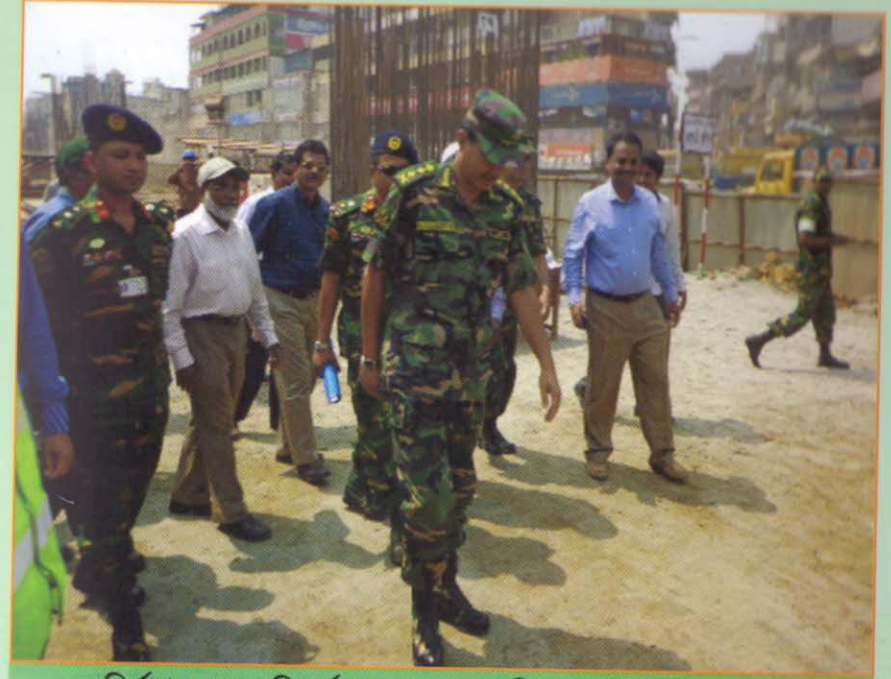
নির্মাণ কাজ পরিদর্শন করছেন মাননীয় সেনাবাহিনী প্রধান