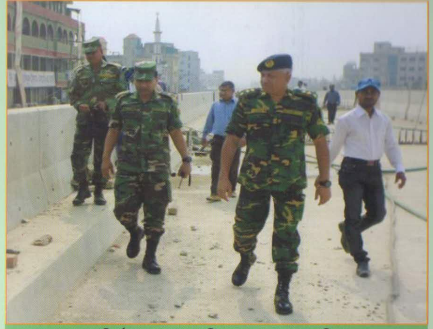
প্রকল্প নির্মাণ কাজ তদারকি করছেন প্রকল্প পরিচালক