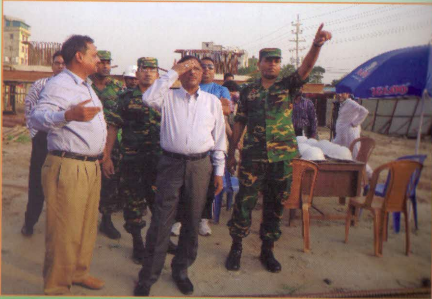
নির্মাণ কাজ পরিদর্শন করছেন মাননীয় সড়ক পরিবহন ও সেতু মন্ত্রী