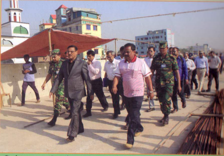
নির্মাণ কাজ পরিদর্শন করছেন মাননীয় সড়ক পরিবহন ও সেতু মন্ত্রী