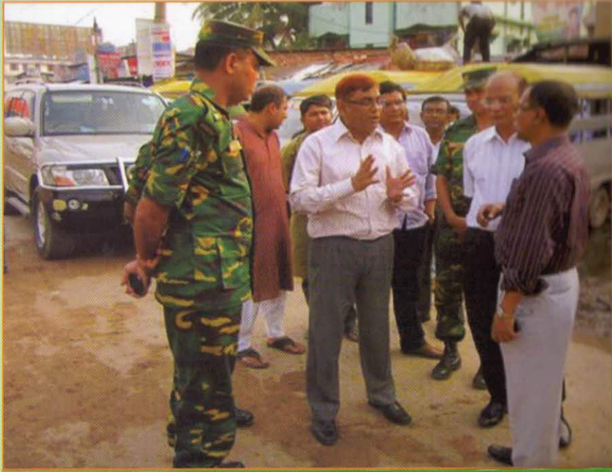
নির্মাণ কাজ পরিদর্শন করছেন মাননীয় সড়ক পরিবহন ও মহাসড়ক বিভাগের সচিব