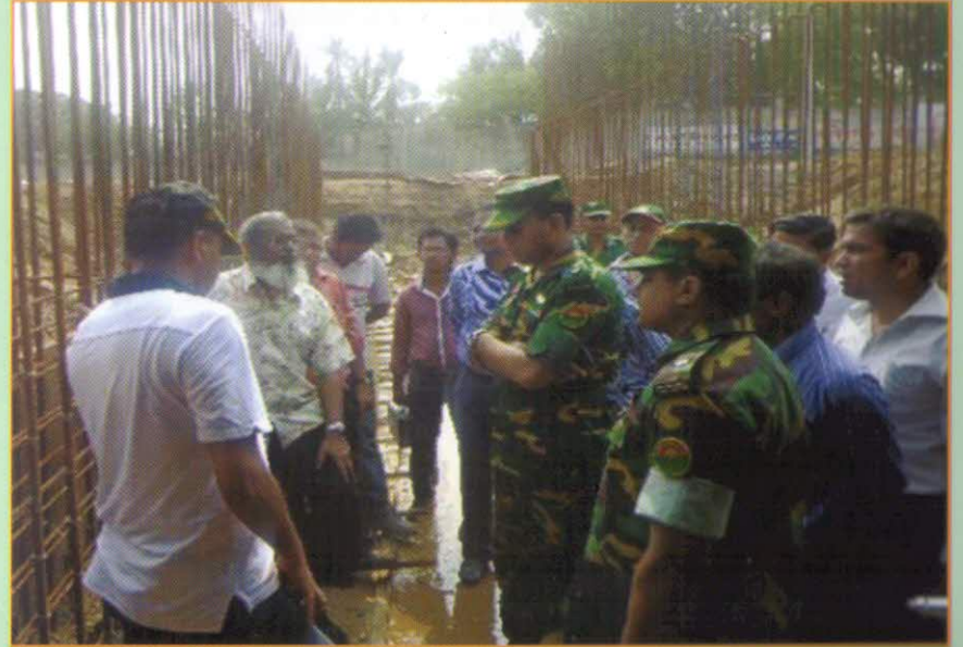
প্রকল্প নির্মাণ কাজ তদারকি করছেন প্রকল্প উপ-পরিচালক